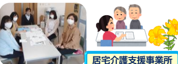
居宅介護支援事業所

居宅支援事業所は、デイサービス・通所リハビリ・ヘルパー支援・ショートステイなどの介護サービスを調整している部署です。担当する職員を「ケアマネジャー」といいます。日々、在宅で変化する要介護者の生活状況を適切に判断し、在宅生活が継続するよう介護サービスに繋げます。介護のことで、なにかお困りごとがあれば遠慮なくご相談くださいませ。(0852-20-1730)