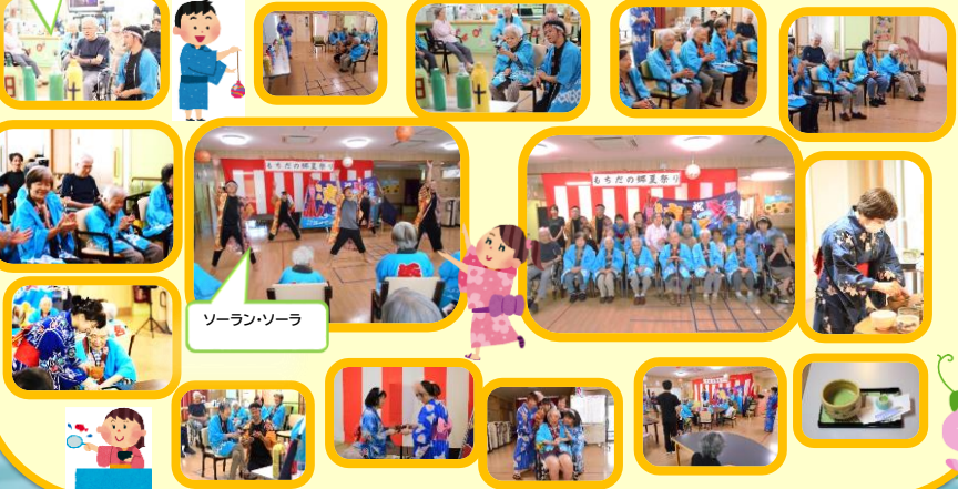
ソーラン・ソーラ